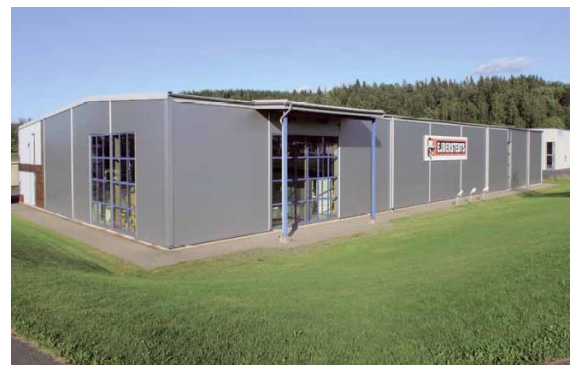
Ejderstedts industrihus sedan 1999

1993 flyttade Ejderstedts till Tenhult där KABE Husvagnar tog emot som hyresvärd. Ejderstedts drevs med god tillväxt ifrån en av Kabes industrilokaler och efter sommaren 1998 var det åter dags att fatta beslut om att bygga industrihus, Ejderstedt andra i ordningen.