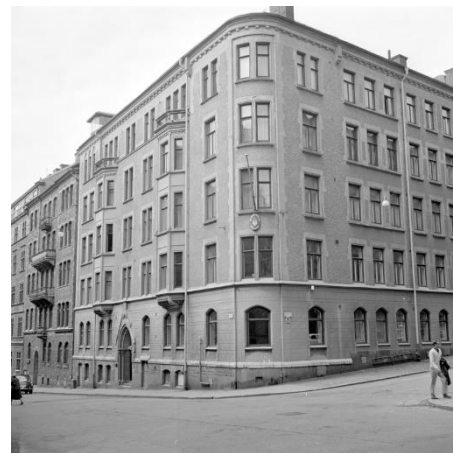
Hörnet av Grevgatan 5 Kaptensgatan.

STIAB bildades i Stockholm på mitten av 1950-talet med uppgift att vara en svensk inköpsorganisation för inköp och maskinförsörjning till den svenska möbel- och snickeriindustrin. Uppdraget var att säkerställa att svensk industri fick tillgång till maskinutbudet från de europeiska maskintillverkarna som ett komplement till svenska maskintillverkarna som på 50 och 60-talet var förhållandevis många.