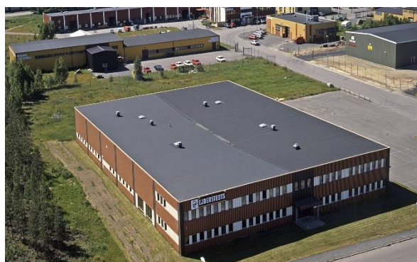
Ejderstedts industrihus 1977