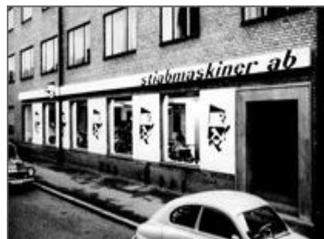
Trädgårdsgatan 2, Jönköping