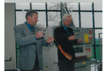
Invigning av industrihuset 1999